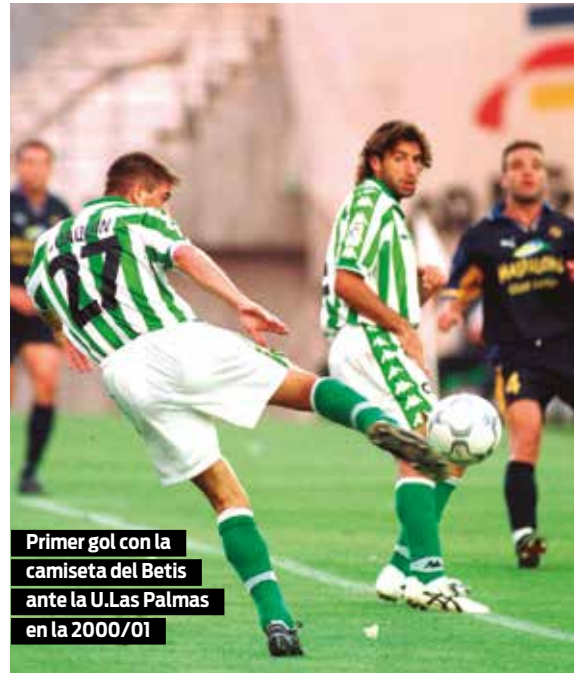
Primer gol con la camiseta del Betis ante la U.Las Palmas en la 2000/01