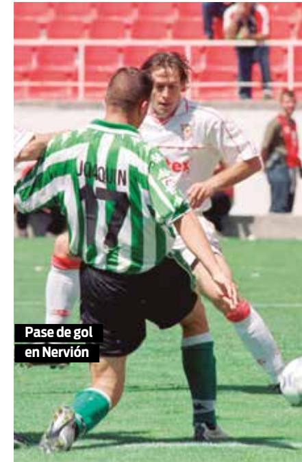
Pase de gol en Nervión