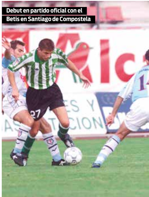
Debut en partido oficial con el Betis en Santiago de Compostela

Porque el crecimiento de aquel chico fue meteórico. Jugó 38 partidos y anotó tres goles, el primero de ellos el 14 de octubre de 2000 ante el Universidad de Las Palmas en el Villamarín. Además, dio asistencias que aún quedan grabadas en la retina de los béticos, como la del derbi del Sánchez-Pizjuan que